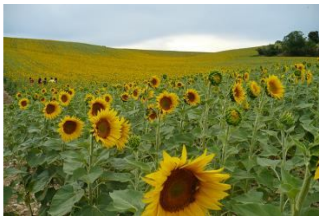
Altopiano di Valensole

Decidiamo ovviamente per la seconda; primo tratto tutto sommato praticabile, poi la strada bella se ne va verso Manosque e a noi resta la D15 che scende fino a Villeneuve dove ci dovrebbe essere un'area attrezzata.