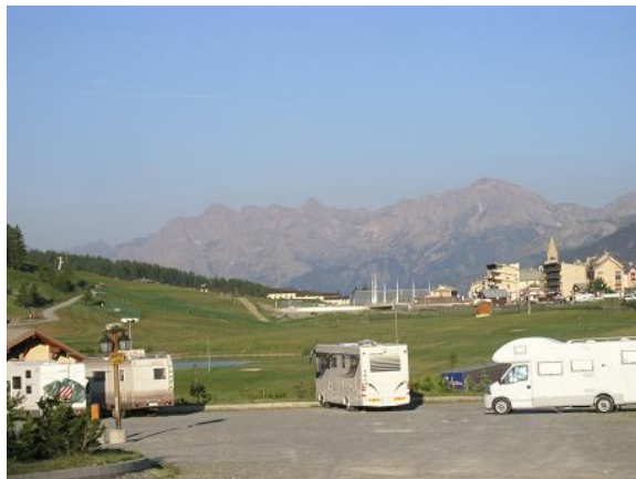
Area sosta Col del Monginevro

Notte che è trascorsa splendidamente grazie all'arietta fresca che entrava dall'oblò; la sveglia suona presto (6.20) perché non abbiamo tempo da perdere..... Colazione, sistemata, pagamento biglietto (€6) e lasciamo l'area di Montgenèvre in perfetto orario; la discesa dal Col mi preoccupava un po', invece è molto bella ed assolutamente fattibile anche per chi è alle prime armi.