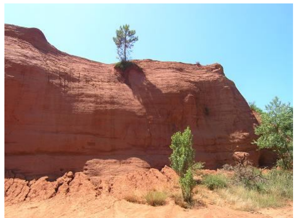
Colorado di Rustrel

Ci addentriamo prima nel "Sahara" e poi su verso le pareti di ocre con dei colori semplicemente meravigliosi; le foto si sprecano sotto un cielo azzurro che rende ancora più suggestivo l'ambiente.