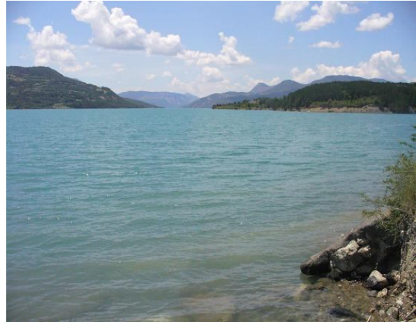
Lago di Serre Ponçon