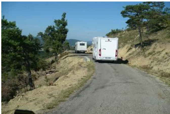
D216 ....la Mitica

Credevamo di aver raggiunto l'apice dell'avventura sulla D15 .....e invece no, questa è molto peggio. Fortunatamente ci va di lusso e l'unica auto che incontriamo è in un tratto leggermente più agibile, dove può far manovra.